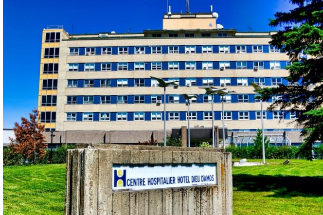
Centre hospitalier Hôtel-Dieu d'Amos

Centre intégré de santé et de services sociaux de l'Abitibi- Témiscamingue